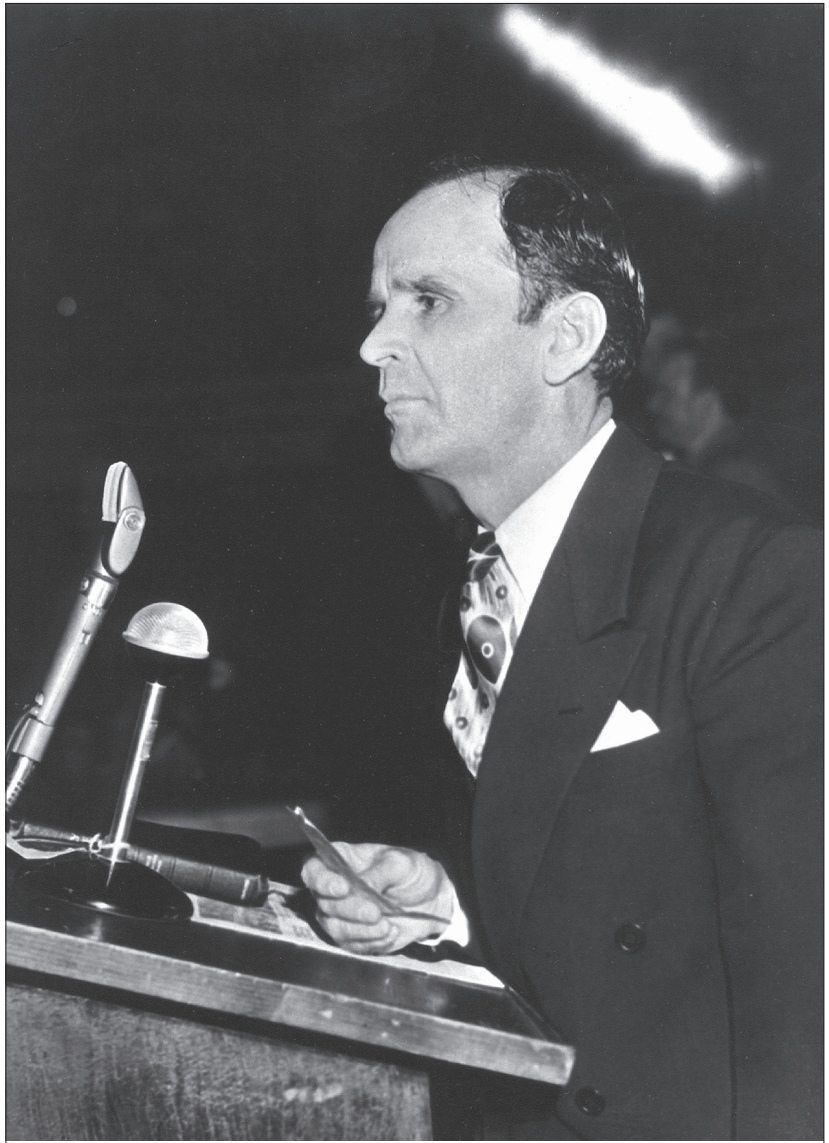
ବାର୍ତ୍ତାବହ-ଦୂତ ଉଲ୍ଲିସ୍‌ମ୍ ମେରିସନ୍ ବ୍ରାନ୍‌ହାମ୍ The Messenger William Marrion Branham